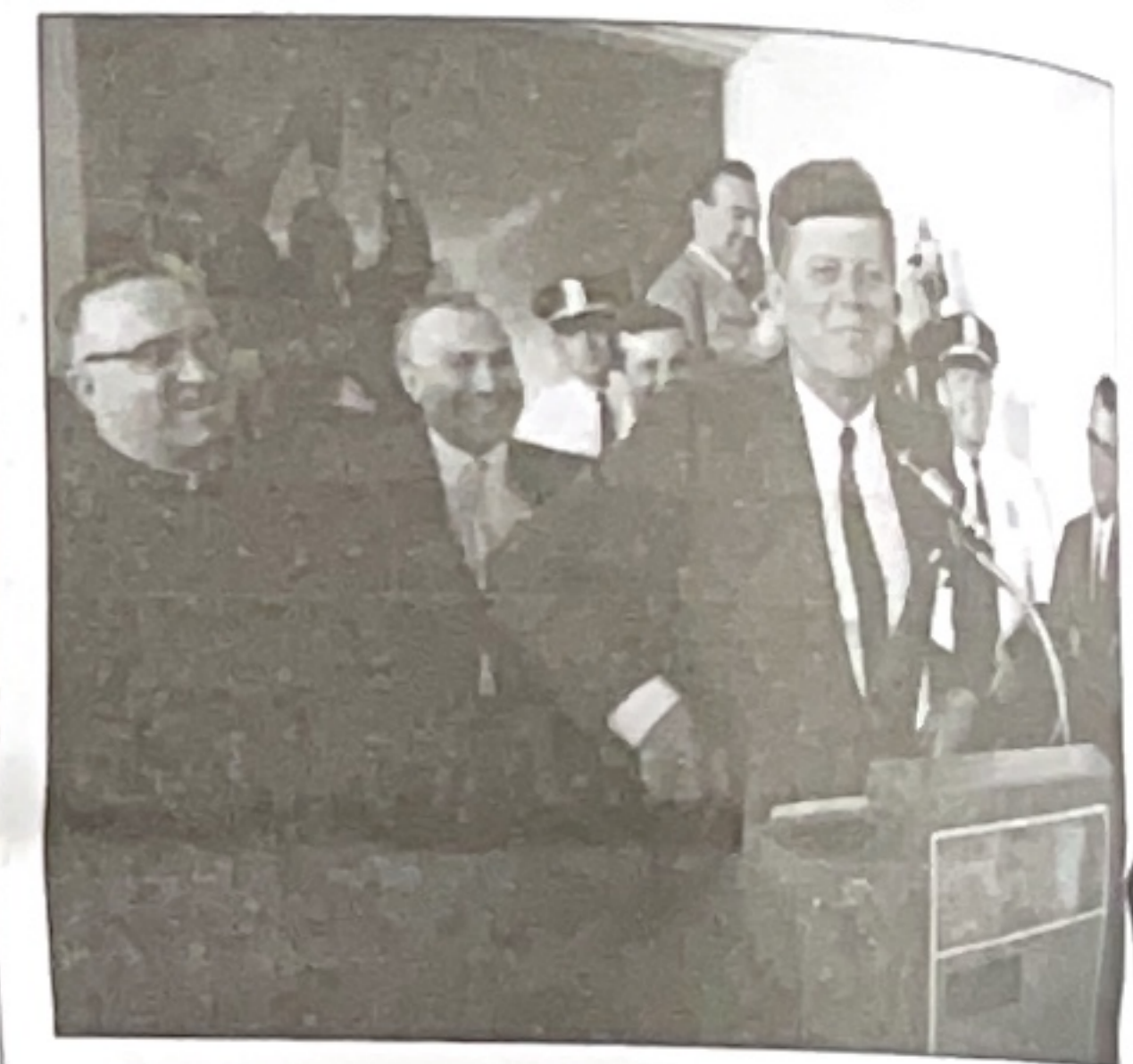
President John F. Kennedy meets with immigration activists just months before his assassination in 1963.

Kennedy announced that day his intention to send proposals for immigration reform to Congress. His assassination cut short those efforts but the proposals became the basis for the 1965 reforms, signed into law by President Lyndon Johnson. The law lifted strict quotas that had been in effect since the 1920s, limiting the entry of immigrants from southern Europe, including Italy.