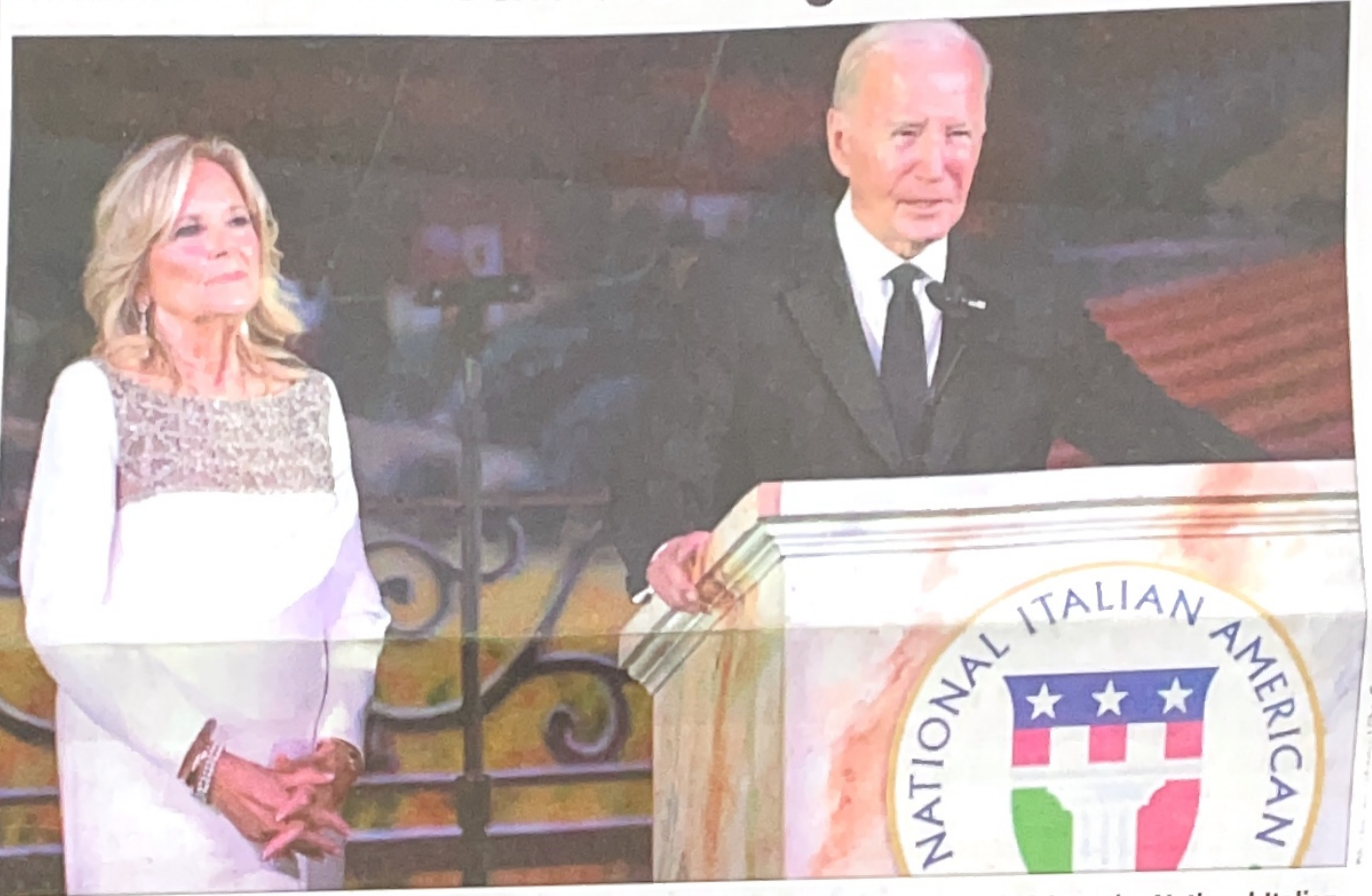
First Lady Jill (Giacoppo) Jacobs Biden and President Joe Biden paid an unannounced visit to the National Italian American Foundation gala. Remarks by Dr. Biden at White House reception for Italian Americans appear on page 4.

Celebrations for October’s Italian American Heritage Month in the nation’s capital were unprecedented, with a reception at the White House hosted by First Lady Jill Biden for Italian American guests, and the surprise visits of Dr. Biden and President Joe Biden at the 48th National Italian American Foundation Gala.